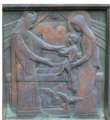
Vignette: Pia Foierl Text: Bergmoser + Höller Verlag

Die Zukunft der Kirche hat kein Lebensalter. Sie liegt weder in den Händen der jungen noch der alten Menschen. Die Zukunft der Kirche ist Christus selbst. Noch einmal wird es heute Weihnachten: Für zwei junggebliebene Wartende füllen sich leere Hände. Simeon und Hanna feiern 40 Tage nach dem Geburtstag Jesu im Tempel.