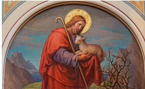
Text: nach Biblisches Sonntagsblatt; Diözese Linz; 4. SO der Osterzeit C

Annemarie Barthel in: www.pfarrbriefservice.de