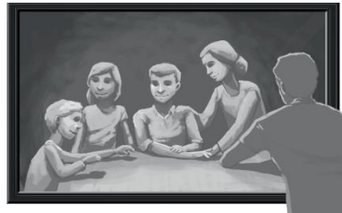
Vignette: David Kramer Text: Bergmoser + Höller Verlag

Jesus hat seine angestammte Heimat, den „Himmel“ aufgegeben und ist in einem Dorf am Rande des römischen Imperiums aufgewachsen. Er hat 30 Jahre provinziell gelebt, doch dann bricht er auf und fällt aus dem Rahmen. Als das einstige Nachbarkind wieder heimkommt und Unerwartetes mit sich bringt, kommt das in der Heimat nicht gut an: Bringe bloß nichts durcheinander! Bei uns soll alles so bleiben wie immer. Hier soll niemand aus dem Rahmen fallen. Hier soll alles störungsfrei ablaufen. Bleibe, wie du bist und lass uns ganz die Alten bleiben! Wie kannst du, mein Nachbar vom Hinterhof, der Messias sein? Jesus bringt die Nazarener zur Weißglut und auch mein Denken immer wieder kräftig durcheinander.